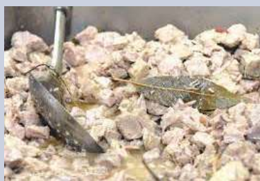
Carne de Vinho e alhos

Em Portugal Continental, come-se o bacalhau cozido com couve portuguesa e as tradicionais rabanadas. Já na Madeira, não pode faltar a carne de vinho e alhos, o famoso bolo de mel e as broas.