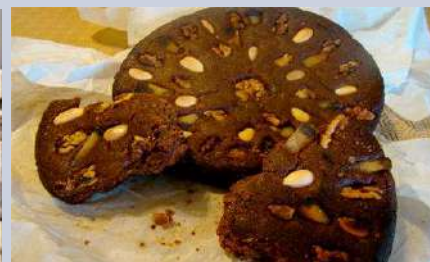
Bolo de mel

Nos Estados Unidos, a Ceia de Natal é celebrada com peru, puré de batata e tarte de abóbora.